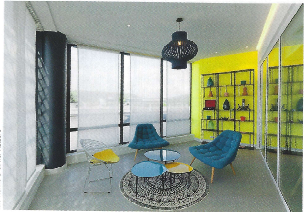
Dés Vianne © Olivier Helbert