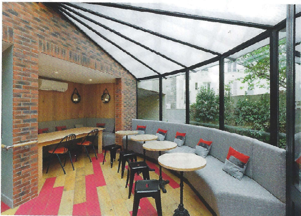
Hôtel IZZY à Issy-les-Moulineaux