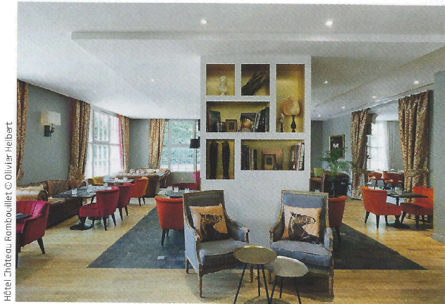
Hôtel Château Rambouillet