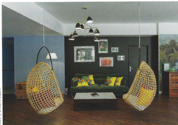
Birdy © Olivier Helbert